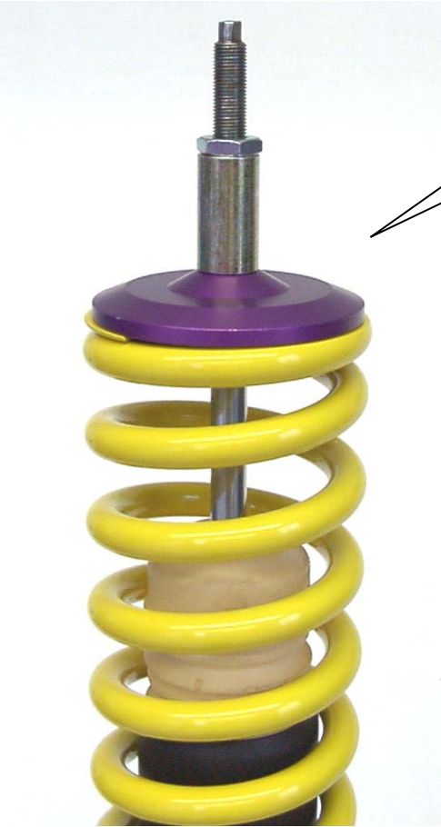
Angeliefertes Federbein. Supplied coilover strut

Das Original - Stützlagergummi und die Zentrierscheibe, wie im Bild dargestellt, aufsetzen, dann das Federbein mit den Originalteilen wie beim Serienfahrwerk mit der Karosserie verschrauben. Das Anzugsdrehmoment der Kolbenstangenbefestigung beträgt 25Nm. Die Einbauhinweise des Federbeines in das Fahrzeug entnehmen Sie bitte den Unterlagen des Fahrzeugherstellers. Assemble the factory bearing rubber and the center disc, as shown on the picture and mount the coilover strut with the factory parts to the chassis like the original suspension. Tightening torque 25Nm (18 ft-lb). Install the strut in the vehicle as specified by the vehicle manufacturer in their document.